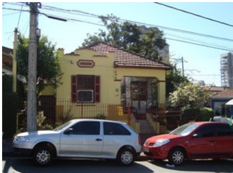
Figura 03. Imóvel sito à Rua Américo Brasiliense, nº 379, localizado na Vila Almeida. Levantamento de campo do projeto “Vilas Operárias (1930-1960)”, 2010.

Nessa mesma perspectiva, a moradia operária – até mesmo diferentemente dos edifícios industriais, que de modo geral se impõem na paisagem por seu grande volume (o que não raro os torna alvo da sanha imobiliária em áreas reputadas como adequadas à refuncionalização) – é pequena, modesta, de feições às vezes acanhadas, não possui um estilo arquitetônico que a identifique, caracterizando-se por sua “funcionalidade”, ou seja, o programa de necessidades que, simplificado e econômico, quase sempre se repete: alpendre, sala, cozinha, dormitório(s).