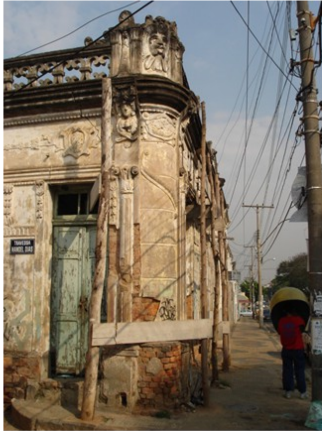
Figura 4: Imóvel da Vila Manoel Dias, escorado, já sob risco iminente de desabamento.