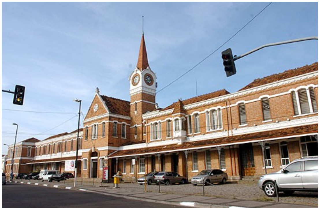
Figura 01. Estação Ferroviária da antiga Companhia Paulista (atual Estação Cultural)

Nesse tombamento, em que o bem protegido passou a ser tratado (ao menos, teoricamente) de uma perspectiva mais abrangente em virtude de suas características de complexo produtivo – em que pese a ainda sensível importância da relevância arquitetônica como critério de seleção dos edifícios protegidos pelo tombamento, em detrimento de uma leitura mais orgânica do bem, atenta às suas particularidades de planta produtiva (FRANCISCO, 2007) – o Colegiado de Campinas sinalizou para o reconhecimento formal da legitimidade dos testemunhos materiais do “mundo fabril” como passíveis de patrimonialização.