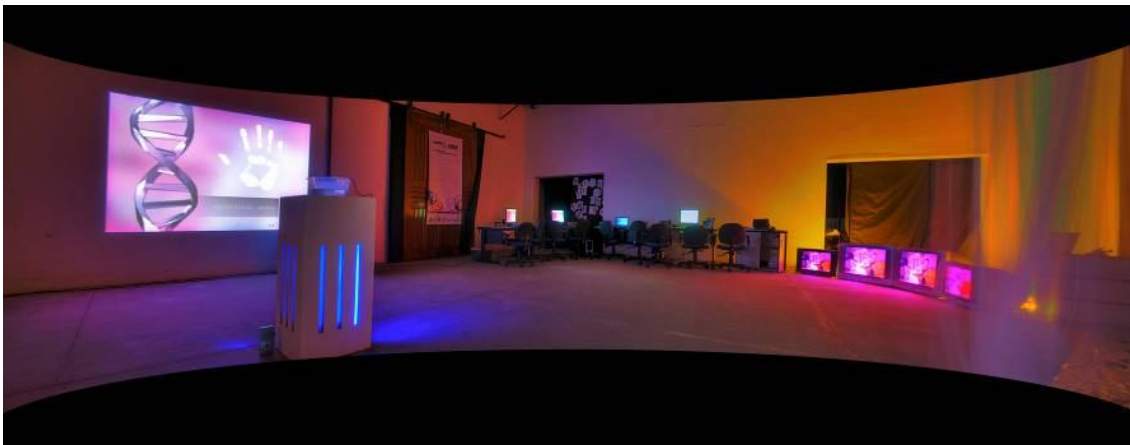
Num dado e-vento: biotecnologia e culturas em vãos, texturas, cores, sons, sombras... Fotografia e montagem – Thiago La Torre

A escolha pelos monstros para movimentar este texto está relacionada à instalação “Jogo dos Monstrinhos” criada pelo artista Thiago La Torre para o evento Num dado e-vento: biotecnologias e culturas em texturas vãos, cores, sombras, sons... 1