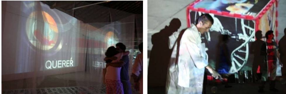
Num dado e-vento: biotecnologias e culturas em vãos, texturas, cores, sons, sombras...

A instalação-evento explorou a potencialidade dos registros fotográficos, em vídeo e áudio, feitos em intervenções anteriores pelo grupo nas ruas de Campinas. A intenção foi a de propor aos visitantes uma experimentação das biotecnologias pelas imagens, palavras e sons. As imagens foram projetadas em grandes paredes, em tules, em plásticos, em espelhos, chão, teto, mãos, braços, roupas, sombras. As imagens ganharam imensas dimensões e suaves materialidades. As pessoas foram convidadas pelos objetos – roupas brancas penduradas na entrada, espelhos para serem manipulados – a misturarem-se às imagens, fazê-las dançar em seus corpos, pulverizá-las em reflexos, em diferentes fragmentos irreconstituíveis. Sombras em movimento, silhuetas dançantes, imagens repartidas, sobreposições. Ao longo da exposição, uma trilha sonora criada trazia sons e palavras que interagiam com as imagens, com os corpos. As imagens, os objetos, os sons foram oferecidos ao público, menos como algo a ser capturado e compreendido e mais como coisas a serem exploradas, vividas caoticamente. Encantamentos em cantos que fomos caracterizando como uma singularidade em aberturas de possibilidades, riscos, jogos, e-vento.