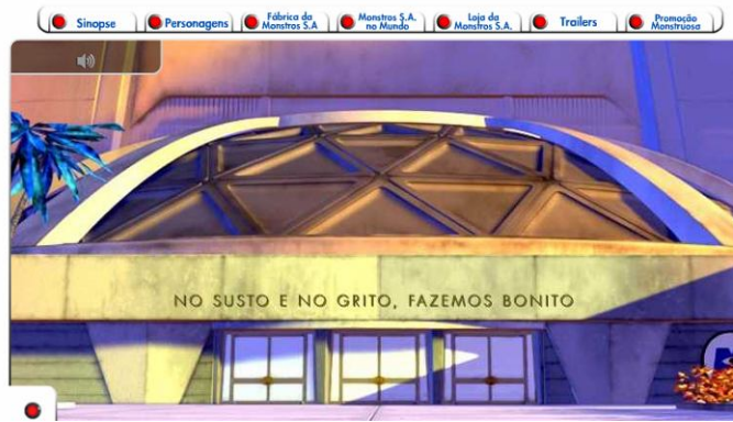
Fábrica de Monstros, Monsters S. A.

Disponível em: http://www.disney.com.br/FilmesDisney/monstros/index2.html Acesso em mai. de 2009