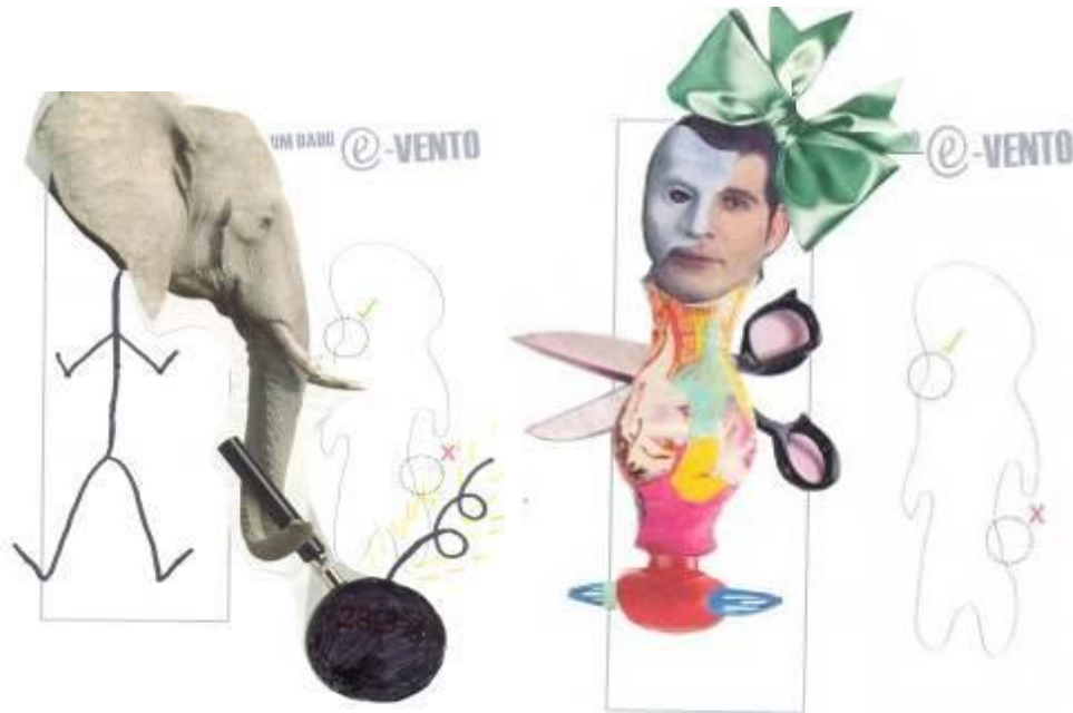
Monstrinhos criados pelos visitantes em instalação do artista Thiago La Torre que fez parte do evento: Num dado e-vento: biotecnologia e culturas em vãos, texturas, cores, sons, sombras...

Na tela de projeção, a partir do movimento da água proporcionado pelo toque das pessoas eram criados monstros. Esses “monstrinhos” eram compostos pelo alinhamento de três imagens que se relacionavam às partes do corpo: “cabeça”, “tronco” e “membros inferiores”.