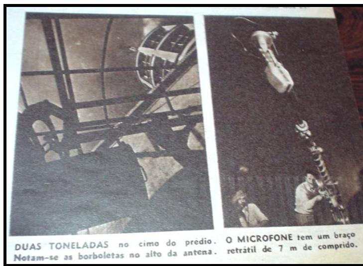
Imagem 5 – O Cruzeiro , 28 out. 1950

A grandiosidade do projeto televisão é expressa ainda em duas outras fotos (Imagem 5) que ocupam a parte inferior da mesma página. Na primeira imagem, há uma tomada da antena a partir do interior do edifício, que permite a visualização da antena no alto do prédio, com o céu ao fundo. Como nos closes da antena e da torre, presentes na reportagem sobre a instalação dos equipamentos no Rio de Janeiro, a foto coloca em destaque a estrutura de metal da antena, neste caso reafirmada pelo verbal, na legenda: “DUAS TONELADAS no cimo do prédio”.