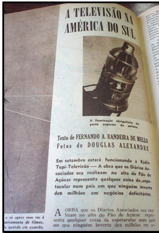
Imagem 2 – O Cruzeiro , 22 jul. 1950

Um segundo ponto de análise é marcado no fio do discurso pela oposição entre ciência e religião, na definição do local para a instalação da antena de TV no Rio de Janeiro. A tensão entre os discursos religioso e da ciência, sendo este último o lugar de dizer sobre a televisão, conforme a revista, marca-se pela interdição da instalação da torre e da antena de TV no morro do Corcovado, como mostra o recorte (2):