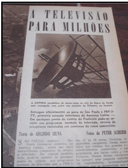
Imagem 4 – O Cruzeiro , 28 out. 1950

A grandiosidade do projeto televisão é expressa ainda em duas outras fotos (Imagem 5) que ocupam a parte inferior da mesma página. Na primeira imagem, há uma tomada da antena a partir do interior do edifício, que permite a visualização da antena no alto do prédio, com o céu ao fundo. Como nos closes da antena e da torre, presentes na reportagem sobre a instalação dos equipamentos no Rio de Janeiro, a foto coloca em destaque a estrutura de metal da antena, neste caso reafirmada pelo verbal, na legenda: “DUAS TONELADAS no cimo do prédio”.