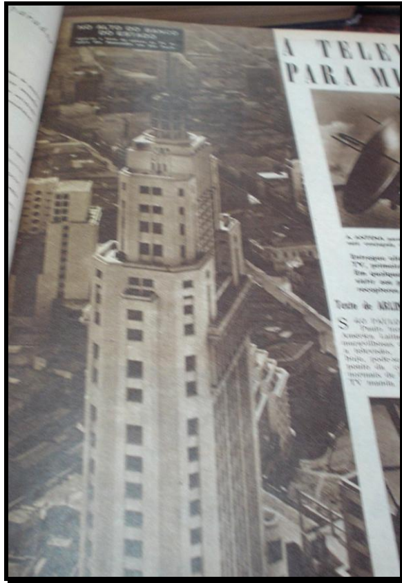
Imagem 3 – O Cruzeiro , 28 out. 1950

local de instalação: o prédio do Banco do Estado, no centro da capital paulista. A primeira foto, exposta no alto da página, abaixo do título da reportagem, traz a imagem da antena instalada no alto do prédio e o seu posicionamento aponta para o lado esquerdo da página, onde se encontra a foto principal, com o prédio em primeiro plano (Imagem 3).