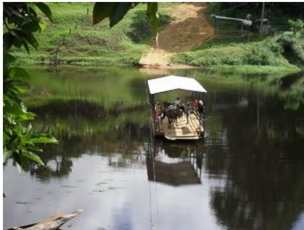
Rio de Contas, Taboquinhas. Autor: Edigley Santos de Jesus

Nesse sentido, trazendo a imagem do rio que permeia e separa a vida em margens, se propõe uma grafia que venha a ressaltar algumas alegorias marcantes entre o filme e o projeto. Uma grafia que possa permitir estar junto dos olhos d'água que brotam no sertão, e de suas lágrimas, que buscam na correnteza gerada nos cruzamentos de saberes tradicionais e acadêmicos, um leito seguro que as faça fluir até a foz do rio junto ao mar, sua terceira e derradeira margem desta viagem. E é na foz que pretendemos desaguar a nossa poética voz, versos em poesia como proposição de considerações finais.