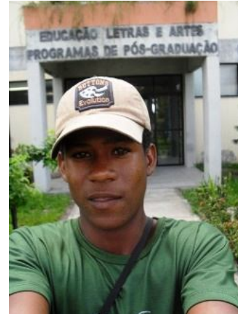
Auto-retrato. Uefs - Feira de Santana. Autor: Edigley Santos de Jesus

Na busca por uma linguagem inclusiva – que integre academia, equipe técnica da Associação Movimento Mecenias da Vida, empresários locais, agricultores, esposas e companheiras e filhos/as, que permita a cada um e a todos eles se expressarem e, ao mesmo tempo, se compreenderem – o projeto “Olhares Cotidianos...” optou por uma linguagem onde a imagem, ainda que privilegiada, se comunicasse com a escrita e a expressão oral. Buscando incluir, nesse processo de aprendizado, a maior diversidade possível de expressões/opiniões/saberes que ajudem a dar continuidade a esse caminhar traçado pela tecnologia socioambiental Turismo CO 2 Neutro. 7