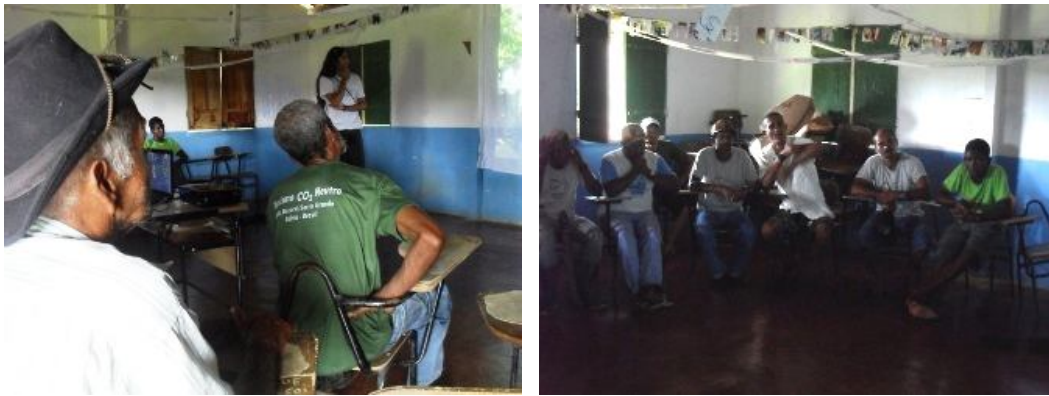
Seleção de fotografias com agricultores. Projeto Olhares Cotidianos (...). Taboquinhas.

possibilitar uma relação dialógica entre os sujeitos e o meio ambiente (SILVEIRA; ALVES, 2008, p. 143).