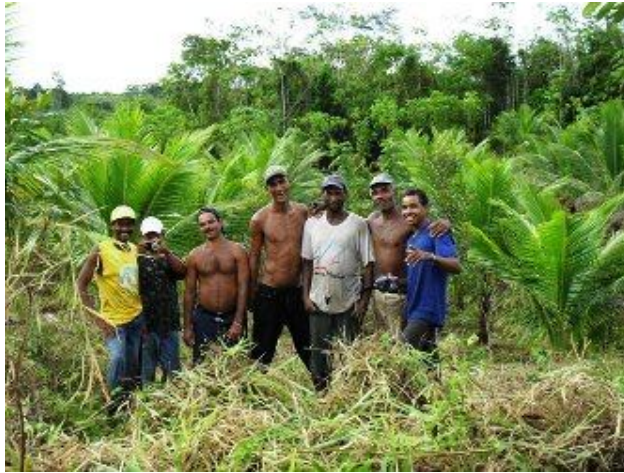
Agricultores, Taboquinhas.

Esses homens do tempo de uma Bahia de todos e tantos Santos são aqui fotografados pelo jovem agricultor Edigley Santos de Jesus, que sonha transpor a barragem das estruturas das políticas sociais e econômicas para chegar ao mar da Educação; seu sonho é cursar uma faculdade.