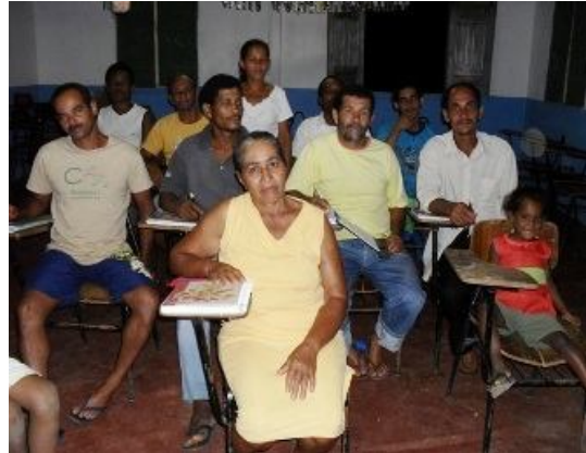
Alfabetização de adultos na zona rural. Taboquinhas. Autor: Miguel Bonfim de Souza

O que poderia vir a espantar os participantes da zona rural do projeto “Olhares cotidianos...”, em sua maioria de pouco ou nenhum letramento, está sendo um elemento a encantar a todos, independentemente do mérito do livro ser ou não “científico”. O que os encanta é poder participar com as fotografias e falas de suas vidas e lidas cotidianas na construção de algo que pode se perpetuar. E a nós o encantamento se encontra no sentimento de participarmos a um livro de páginas e esquinas vivas, com suas dobras de vidas expressivas em imagens e grafias, em preto e branco além de coloridas.