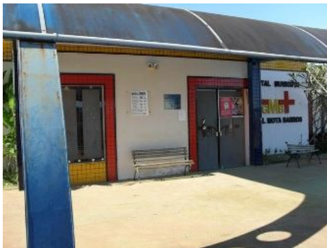
Hospital, Taboquinhas. Autor: Miguel Bonfim de Souza