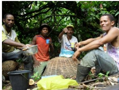
Experimentando com a câmera fotográfica, colocando no disparador automático. Taboquinhas.