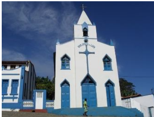
Igreja de Taboquinhas.

A primeira fotografia a ser questionada, mas de imediato voltada ao grupo das escolhidas, foi a da Igreja Católica de Bom Jesus da Lapa de Taboquinhas, pois o parecer contra, da bancada evangélica, não foi suficiente para a exclusão da foto.