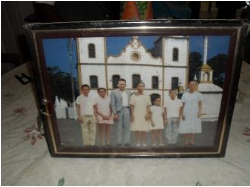
Lembrança familiar. Taboquinhas. Autor: Miguel Bonfim de Souza