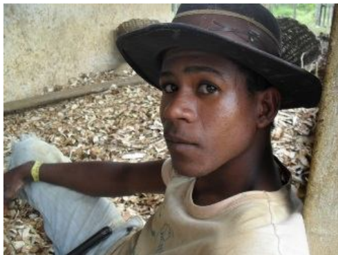
Auto-retrato, Taboquinhas.