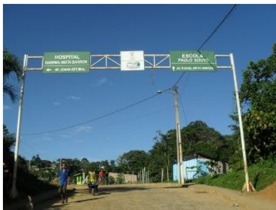
Ladeira, Taboquinhas.

(...) No processo de produzir imagens e analisá-las, os sujeitos envolvidos olham para si, para o outro, e para seu entorno, num movimento de resignificação do conhecido. O trabalho com as fotografias possibilita relações entre saberes, entre vozes e silêncios: outras explorações com/nas/das imagens, possibilitando um pluri-álgo de conhecimentos, sensações, registros, memórias, divulgação. Sentimentos que nos movimentam pelas imagens e nos colocam a entendê-las como intensivas personagens na contemporaneidade (ANDRADE et al. , 2010, p. 2469).