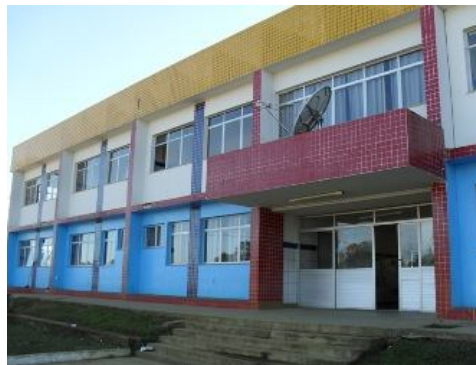
Escola "Paulo Souto", Taboquinhas. Autor: Miguel Bonfim de Souza