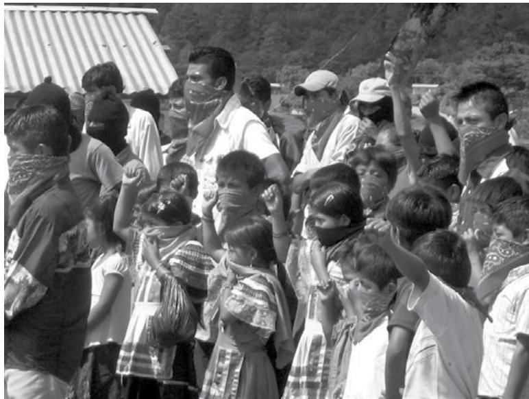
Imagem 1 – Grupo de zapatistas em manifestação, no México